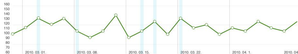
diagram: xls letöltés pdf letöltés

jelmagyarázat: ○ automatikus mérés □ kézi mérés ● átlagolt mérések